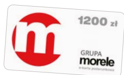
Karta podarunkowa morele.net - 1200 zł