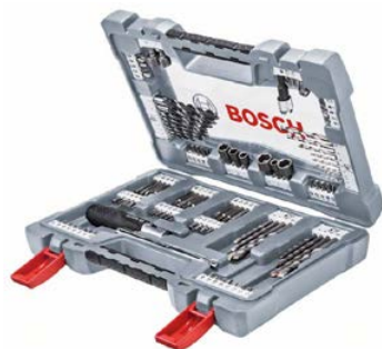
Zestaw wiertel i bitów 105 szt Bosch Premium X-Line