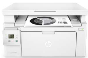
HP LaserJet Pro M130a