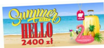
Voucher wakacyjny o wartości 2400 zł