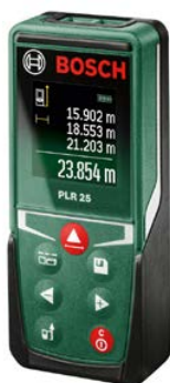
BOSCH PLR 25 dalmierz laserowy O603672521