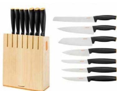
Fiskars Zestaw noży w bloku