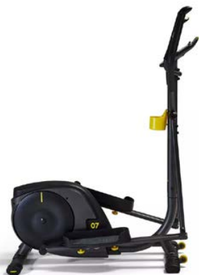
Rower eliptyczny EL 500