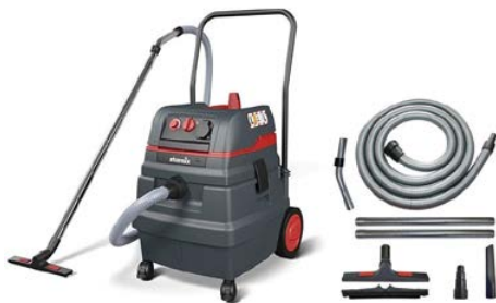
Odkurzacz Starmix ISC L-1650 TOP Compact