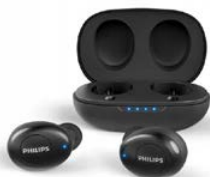
Philips UpBeat TAUT102BK czarny