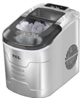
Kostkarka do lodu TCL ICE-S