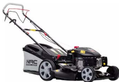
Kosiarka spalinowa Nac LS50-196-HS-NG