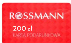
Karta podarunkowa Rossmann 200 zł