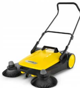
Zamiatarka Karcher S 6 Twin