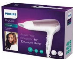
Philips dry care BHD186/00