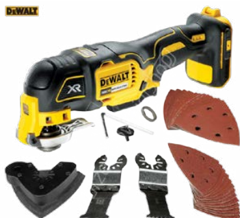
Narzędzie oscylacyjne DEWALT DCS355N MULTITOOL