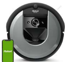
iRobot Roomba i7