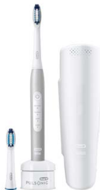
ORAL-B Pulsonic Slim Luxe 4200