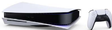
Play Statnion PS5