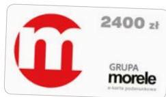
Voucher morele.net 2400 zł