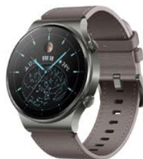
Smartwatch HUAWEI Watch GT 2 Pro Classic