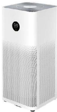
Oczyszczacz powietrza Xiaomi Mi Air Purifier 3H