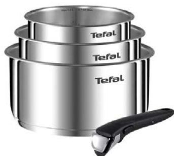
Zestaw garnków TEFAL Ingenio Emotion L9254S14 (4 elementy)